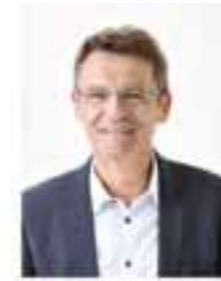
Peter Klär Bürgermeister der Kreisstadt St. Wendel