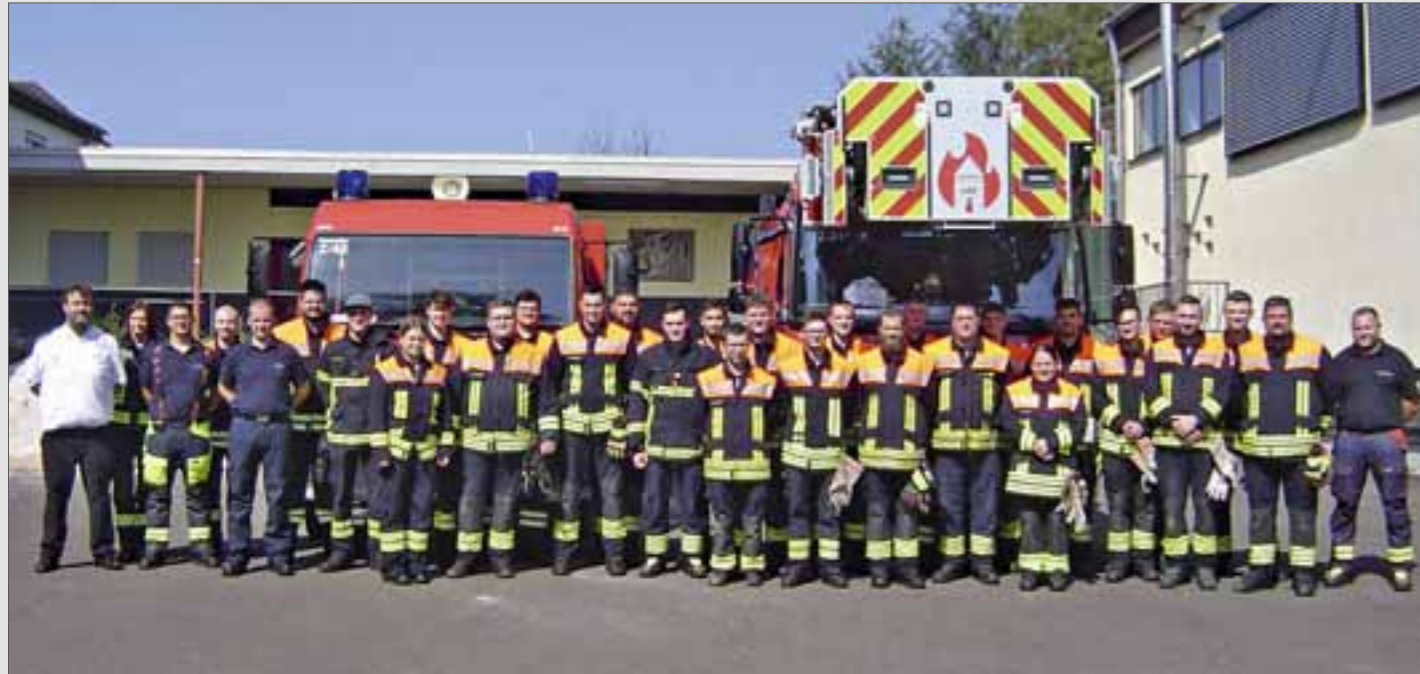
Die erfolgreichen Teilnehmer und ihre Ausbilder.

Bei der Freiwilligen Feuerwehr der Gemeinde Nonweiler haben 25 junge Aktive ihre Ausbildung zum Truppmann erfolgreich beendet.