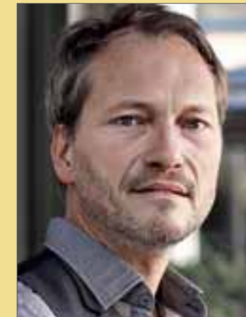
Herbert Schäfer

Am Montag, 14. Oktober, um 19.30 Uhr, beginnt im Saalbau St. Wendel, Balduinstraße 45, die neue Saison im Rahmen des Spielplans der Theatergemeinschaft St. Wendel.