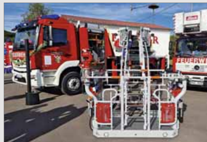
Die neue Gelenkdrehleiter.